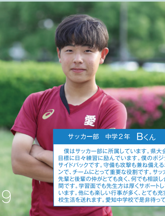
サッカー部 中学2年 Bくん

僕はサッカー部に所属しています。県大会出場を目標に日々練習に励んでいます。僕のポジションはサイドバックです。守備も攻撃も兼ね備えるポジションで、チームにとって重要な役割です。サッカー部は先輩と後輩の仲がとても良く、何でも相談し合える仲間です。学習面でも先生方は厚くサポートしてください。他にも楽しい行事が多く、とても充実した学校生活を送れます。愛知中学校で是非待っています！