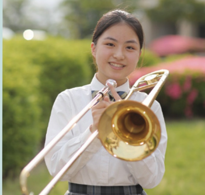
吹奏楽部 中学2年 Aさん

中学生と高校生が合同でJazzの演奏を中心に活動しています。フルート、サクソ、トランペット、トロンボーン、リズムのパートがあり、未経験でも個性豊かで優しい先輩方が丁寧に教えてくださるのでどんどん上達します！勉強との両立は大変ですが、一日のスキマ時間を有効活用して頑張っています。文化的発表会や定期演奏会、夏には神戸で行われる大会など発表する機会が多いので、とても達成感があり充実しています。愛知中学と一緒にJazzを奏でてみませんか。